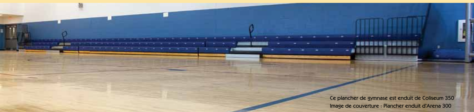
Ce plancher de gymnase est enduit de Coliseum 350 Image de couverture : Plancher enduit d'Arena 300

Les produits pour planchers de bois Coliseum sont disponibles en seaux de 5 gallons